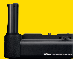
BLOC ALIMENTATION MB-N10