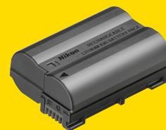
ACCUMULATEUR LI-ION EN-EL15C