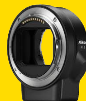
ADAPTATEUR POUR MONTURE FTZ